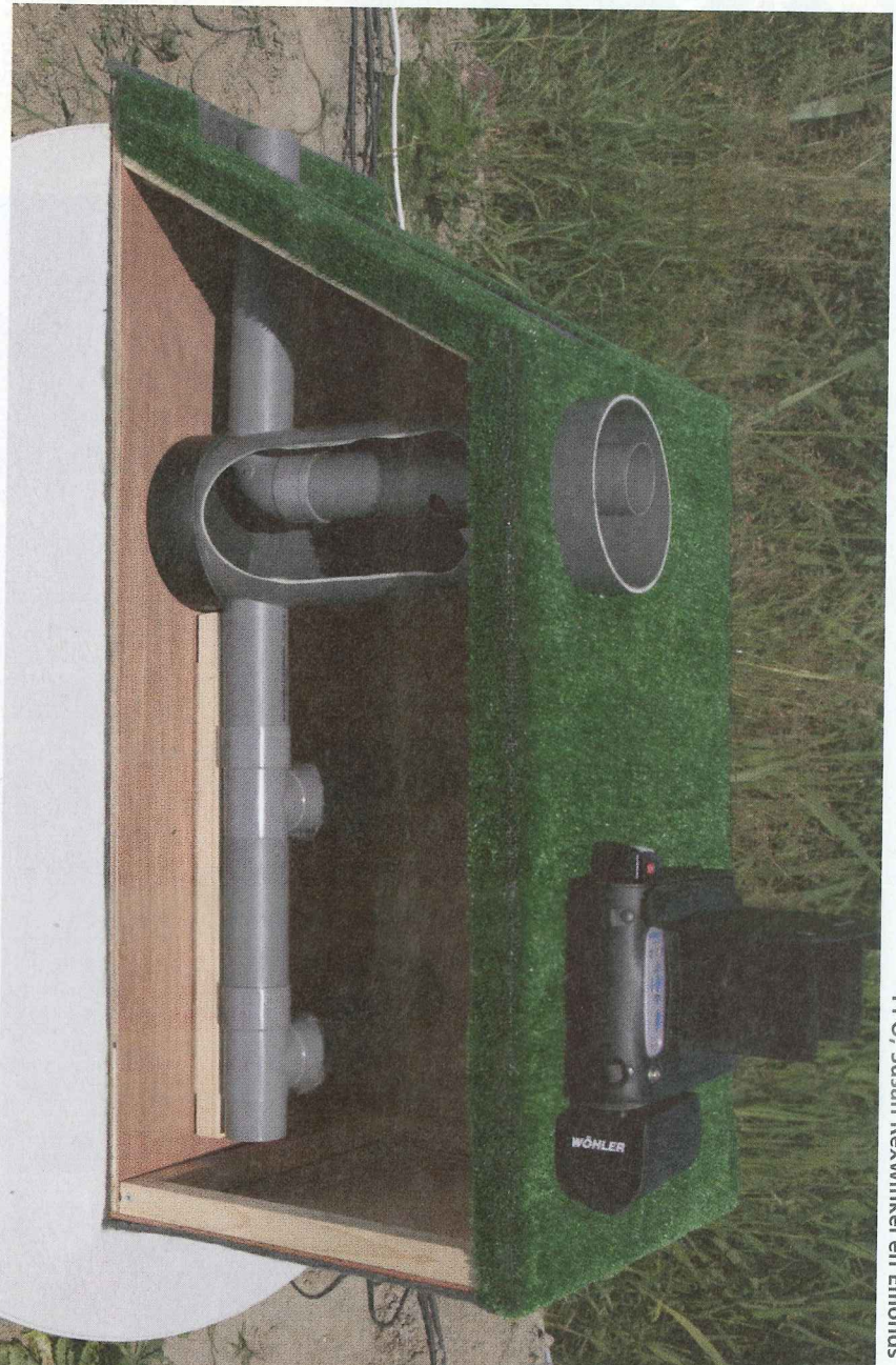
In deze kunstmatige doorsnede is de werking van het drainage-systeem te zien.

Tekst: Franka Loman